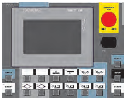
CONTROL PANEL: SIEMENS (X)