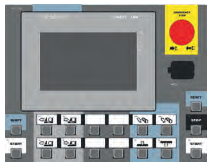
CONTROL PANEL: SIEMENS (X-CNC)