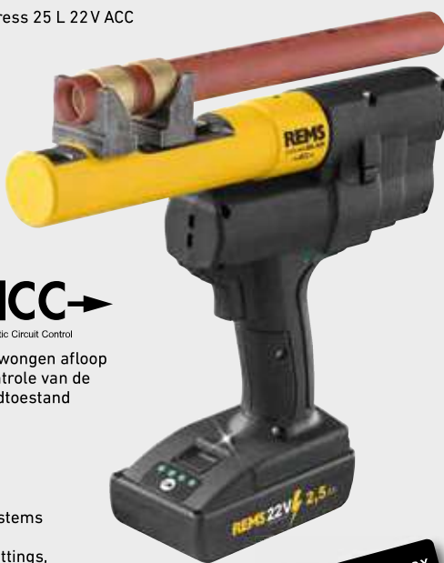
REMS Ax-Press 25 L 22V ACC