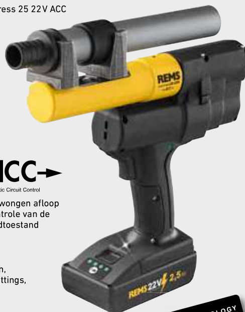
REMS Ax-Press 25 22V ACC

Verschiede buisoptrompers en het complete assortiment REMS optrompkoppen voor alle gangbare drukhulssystemen (pagina 251 – 255).